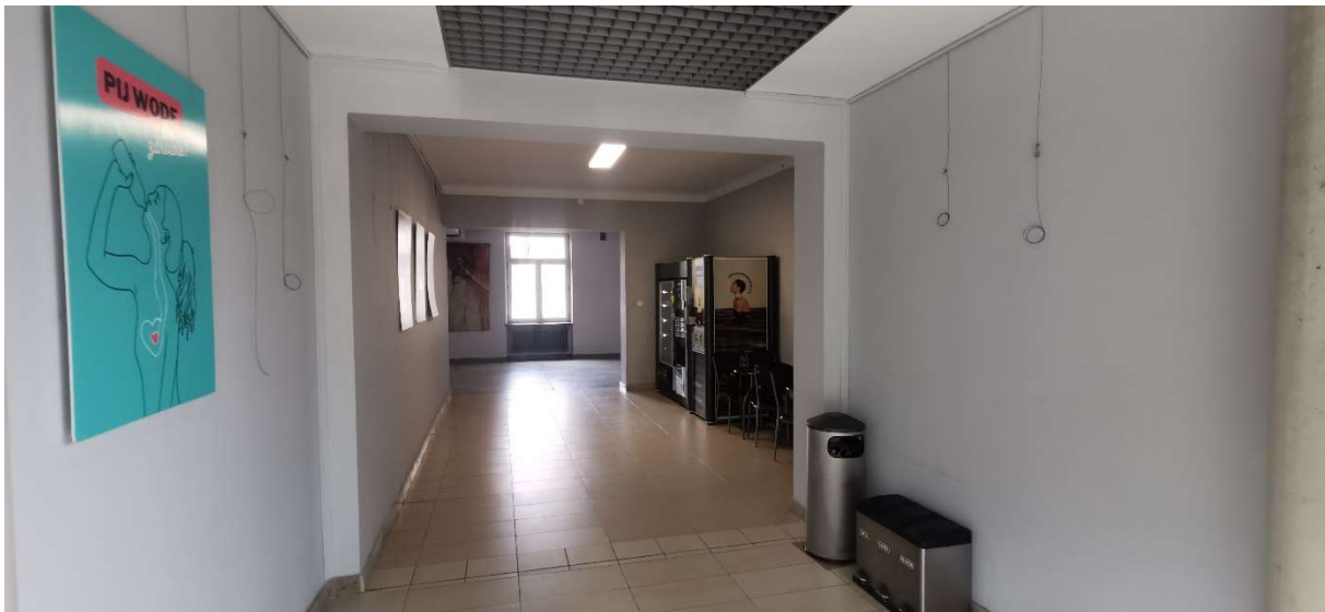
Fotografia nr2 -widok na miejsce montażu drzwi pożarowych od strony łącznika do budynku B