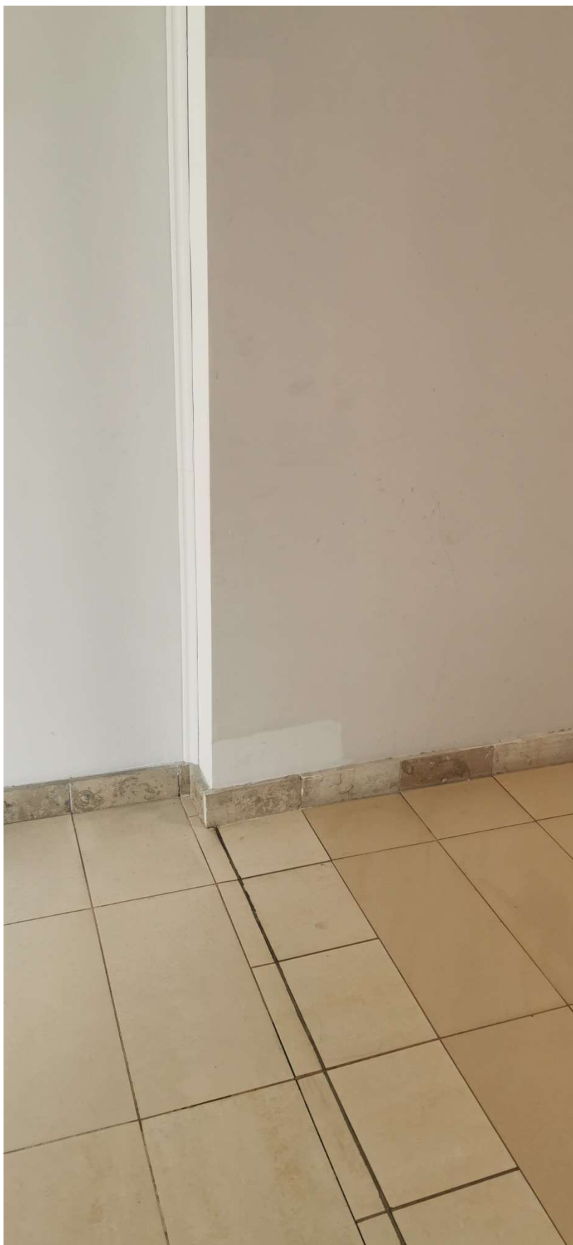
Fotografia nr4 -widok na podłogę w miejscu montażu drzwi pożarowych