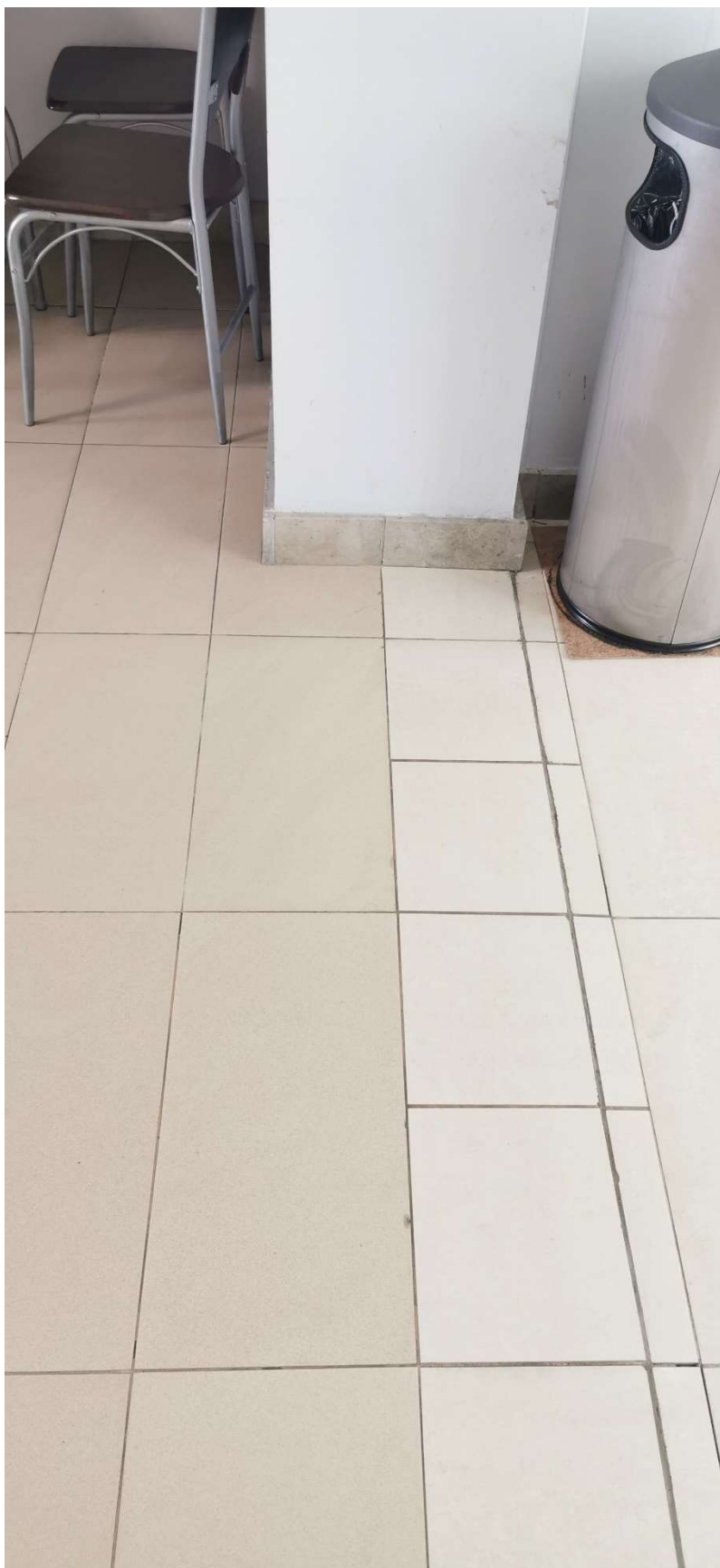
Fotografia nr3 -widok na podłogę w miejscu montażu drzwi pożarowych